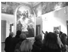
"In giro per musei": visite guidate alle pinacoteche di Ancona, Jesi, Loreto ed alla Mole Vanvitelliana – sede museo tattile Omero