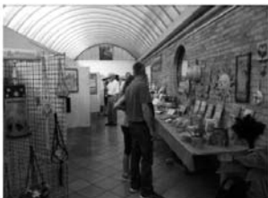
Mostra al Centro sociale di Polverigi delle opere realizzate nei vari laboratori