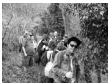
"La vita e il fiume": escursioni guidate lungo l'Esino ed il Sentino